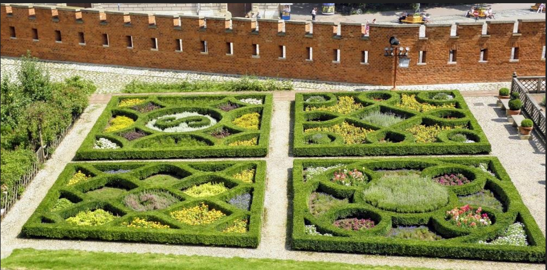
Wawel, 2018r. 20